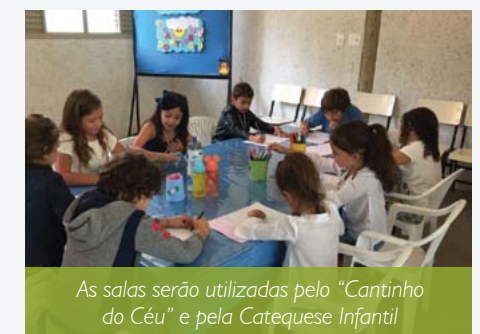
As salas serão utilizadas pelo “Cantinho do Céu” e pela Catequese Infantil

informações sobre a catequese infantil e o Cantinho do Céu na comunidade, entre em contato com nossa secretaria paroquial: (31) 3286-3034.