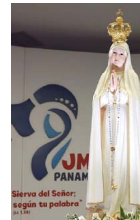
Imagem de Fátima estará presente na JMJ DO Panamá

A imagem de Nossa Senhora de Fátima estará presente na Jornada Mundial da Juventude do Panamá, que será realizada em janeiro de 2019. A notícia foi divulgada durante uma coletiva de imprensa pelo arcebispo de Cidade do Panamá, Dom José Domingo Ulloa Mendieta, acompanhado de uma delegação do Santuário português. Será a primeira vez desde o ano 2000 que a imagem sai de Fátima. De fato, a reitoria do Santuário decidiu que ela permaneceria ali depois de peregrinar por 64 países. A exceção será justamente o Panamá. A decisão foi tomada em vista da importância deste evento mundial, sobretudo em relação a São João Paulo II, idealizador das Jornadas, cuja devoção pela Virgem é bem conhecida.