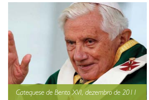
Catequese de Bento XVI, dezembro de 2011

O Senhor nos conceda sermos capazes de uma oração sempre mais intensa, para reforçar nossa relação pessoal com Deus Pai, alargar nosso coração à necessidade dos que nos são próximos e sentirmos a beleza de ser "filhos no Filho", unidos com tantos irmãos.