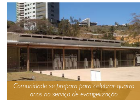
Comunidade se prepara para celebrar quatro anos no serviço de evangelização

após a celebração da missa das 10h na Comunidade Bom Jesus do Vale. Aqueles que adquirirem as cartelas antecipadamente vão concorrer à brindes que serão sorteados no dia da festa. Quem quiser participar como voluntário, ou com algum tipo de doação, pode deixar o contato na secretaria paroquial (telefone 3286-3034) que os organizadores entrarão em contato posteriormente.