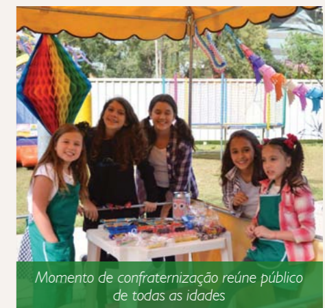
Momento de confraternização reúne público de todas as idades

sorteados no dia da festa. Quem quiser participar como voluntário, ou com algum tipo de doação, pode deixar o contato na secretaria paroquial (telefone 3286-3034) que os organizadores entrarão em contato posteriormente.