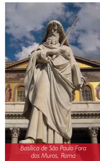
Basílica de São Paulo Fora dos Muros, Roma

O Apóstolo Paulo foi uma das pessoas mais importantes da Igreja. A sua conversão, narrada em Atos 9, nos dá ideia da dimensão do plano de Deus para ele. "E eu te mostrarei o quanto deverá sofrer por amor do meu Nome...". Mas infelizmente a morte deste homem não foi das mais calmas. Ele foi decapitado em Roma, durante o reinado de Nero. Na verdade, não encontramos uma citação bíblica sobre o local preciso e a forma com que Paulo foi morto. O que consta são escritos e testemunhos da tradição cristã que foram desde o início aceitos e narrados como verdadeiros. Devido a sua cidadania romana, ele acaba tendo um tratamento mais "humano" do que Pedro, por exemplo. Este último foi crucificado de cabeça para baixo, por se declarar indigno de morrer como Cristo morreu.