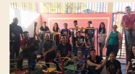
Jovens e artistas católicos praticam solidariedade em creches, hospitais, lar de idosos, entre outros espaços