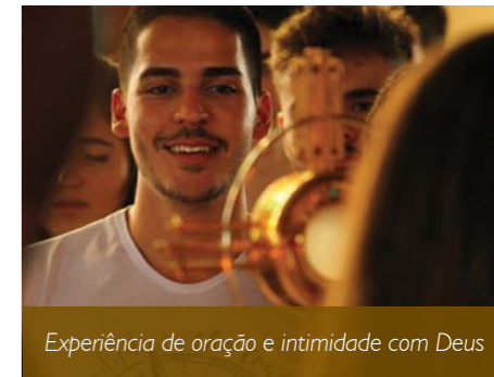
Experiência de oração e intimidade com Deus

(@goff_fanuel), onde a pessoa pode conhecer mais sobre as atividades e perfil do movimento.