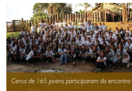
Cerca de 165 jovens participaram do encontro