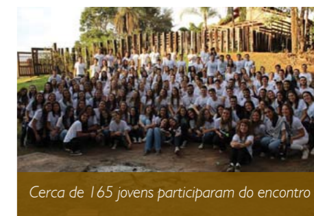
Cerca de 165 jovens participaram do encontro