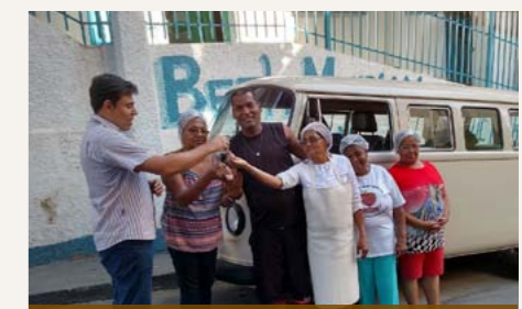
Veículo foi doado com a ajuda de vários paroquianos da NSRainha