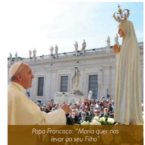
Papa Francisco: "Maria quer nos levar ao seu Filho"

Deus deu de uma forma muito simples, para que pudesse atingir o coração das crianças, mas ao mesmo tempo consolar e resgatar a tradição da Sagrada Escritura, trazendo a conversão, a mudança de vida". Celebrando hoje também o dia dedicado às mães, peçamos: Nossa Senhora de Fátima, rogai por nós!