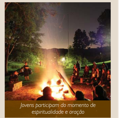
Jovens participam do momento de espiritualidade e oração

O Master se reúne todas as quartas-feiras, às 20h, no Salão Paroquial Pedro. Informações pelo instagram: @masterfanuel.