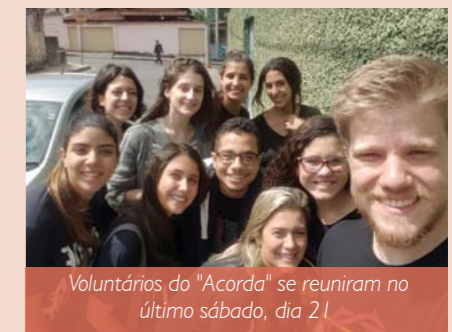
Voluntários do "Acorda" se reuniram no último sábado, dia 21

através do Instagram: www.instagram.com/acordafanuel .