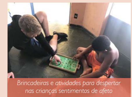
Brincadeiras e atividades para despertar nas crianças sentimentos de afeto