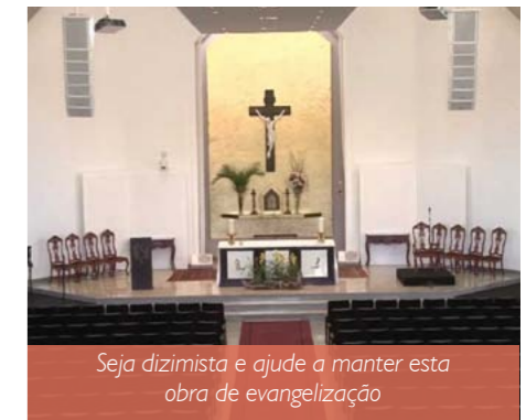
Seja dizimista e ajude a manter esta obra de evangelização

"Acesse o Youtube da Paróquia (youtube.com/nsrainha) e confira o vídeo da nossa campanha deste ano. Em nossa comunidade é assim: seja bem-vindo e sinta-se em casa!