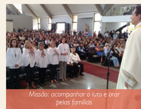
Missão: acompanhar o luto e orar pelas famílias