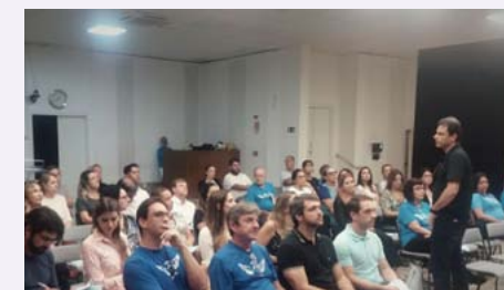
Encontro contou com a participação de 60 voluntários, entre “anjos” novos e já atuantes

dade para comparecer regularmente. É só entrar em contato com a secretaria paroquial, pelo telefone (31) 3286-3034.