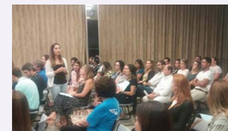
Para ser um “anjo” não é necessário ser um profissional da área de saúde