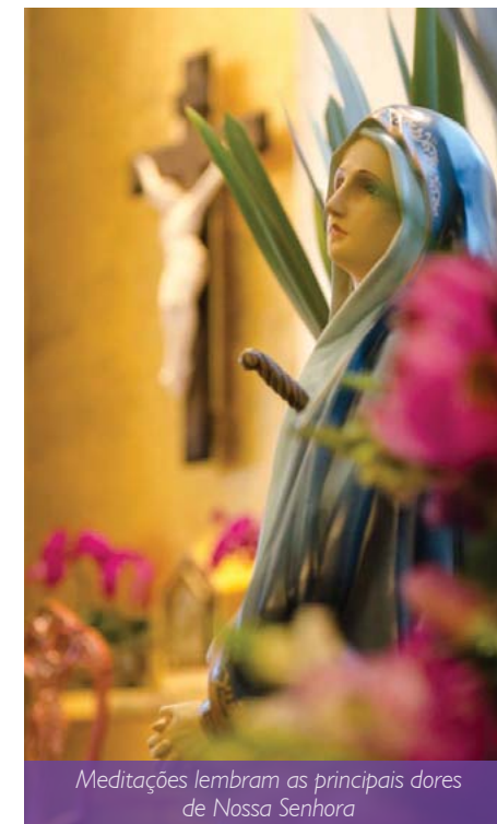
Meditações lembram as principais dores de Nossa Senhora

A programação completa do Setenário das Dores de Maria e do Seminário “Gratia Plena” você confere no site da paróquia: www.nsrainha.com.br .