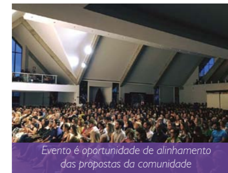
Evento é oportunidade de alinhamento das propostas da comunidade

Se você é voluntário em nossa comunidade, contamos com sua participação!