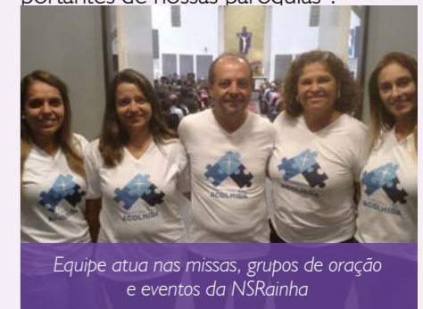
Equipe atua nas missas, grupos de oração e eventos da NSRainha