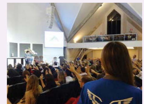
Os “Anjos” são responsáveis pelo primeiro atendimento na Paróquia

volvido pelo Anjos é essencial para o andamento da Paróquia. “Essa pastoral tem uma missão especial, é um grupo com um olhar missionário e de cuidado com o próximo”. O grupo se reúne toda segunda segunda-feira do mês, e para participar não é necessário se inscrever previamente.