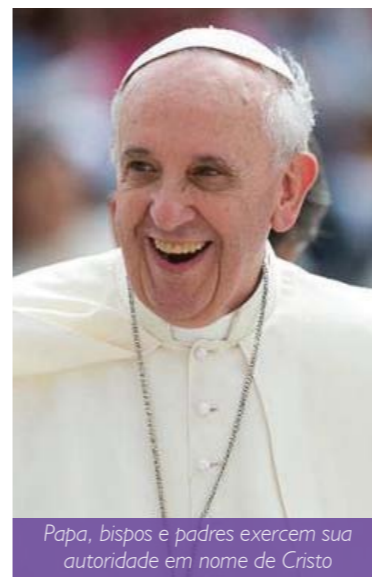
Papa, bispos e padres exercem sua autoridade em nome de Cristo