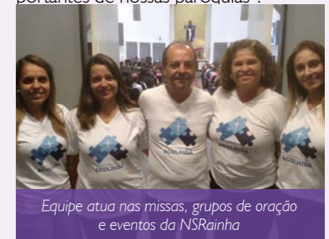
Equipe atua nas missas, grupos de oração e eventos da NSRainha