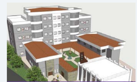
Projeto está sendo construído no bairro Dom Cabral, região Noroeste de BH.

dela receber a irradiação das experiências e ações na tarefa missionária de “Proclamar a Palavra”. Também sediará o Projeto Saúde+ para promover o cuidado preventivo com a saúde de padres, diáconos, religiosos e agentes de Pastoris; eventos e celebrações e retiros e programas de evangelização a serviço da Igreja/Paróquias e suas instituições.