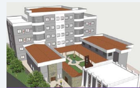
Projeto está sendo construído no bairro Dom Cabral, região Noroeste de BH.

dela receber a irradiação das experiências e ações na tarefa missionária de “Proclamar a Palavra”. Também sediará o Projeto Saúde+ para promover o cuidado preventivo com a saúde de padres, diáconos, religiosos e agentes de Pastoris; eventos e celebrações e retiros e programas de evangelização a serviço da Igreja/Paróquias e suas instituições.