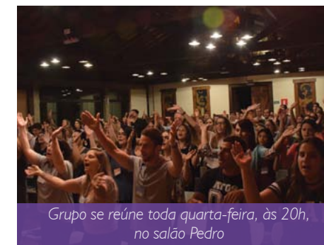
Grupo se reúne toda quarta-feira, às 20h, no salão Pedro

Você pode acompanhar a programação e as fotos dos encontros pelo site da paróquia ou através da página do grupo Master no facebook.com/masterfanuel.