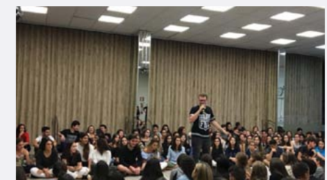
Juventude do Fanuel se articula em grupos para todas as idades e carismas