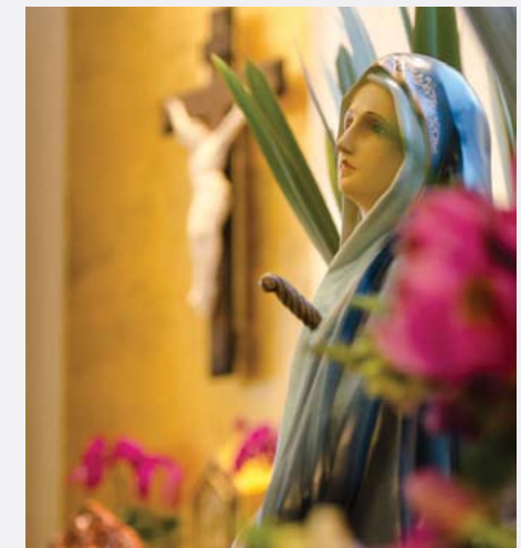
Convidados vão refletir sobre a participação de Maria na Redenção