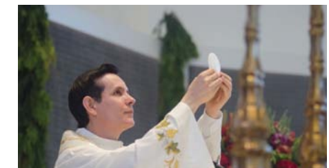
Mudanças ocorrem no sábado e durante a semana

pela Liturgia da Palavra e uma pequena parte da Liturgia Eucarística, a saber: Oração do Pai Nosso, Apresentação (Eis o Cordeiro de Deus que tira o pecado do mundo...), Comunhão Eucarística, Ação de Graças e Oração Pós-Comunhão. Embora semelhante, a Celebração da Palavra é diferente da Santa Missa, na qual há oferta, há uma vítima que se entrega, há o sacrifício, ou melhor, a renovação “Do Sacrifício”, fato esse que não se faz presente numa Celebração da Palavra.