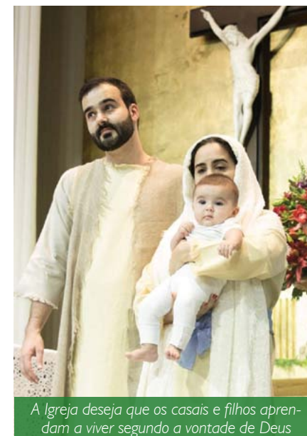
A Igreja deseja que os casais e filhos aprendam a viver segundo a vontade de Deus