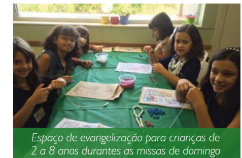
Espaço de evangelização para crianças de 2 a 8 anos durante as missas de domingo

chegar uns 15 minutos antes do início da celebração eucarística para preencher uma ficha, que servirá de base para a confecção de um crachá para a criança. Os coordenadores lembram que, no caso de crianças de 2 anos, é necessário que o pai ou a mãe fique com o (a) filho (a) nas primeiras participações até que a criança se sinta adaptada.