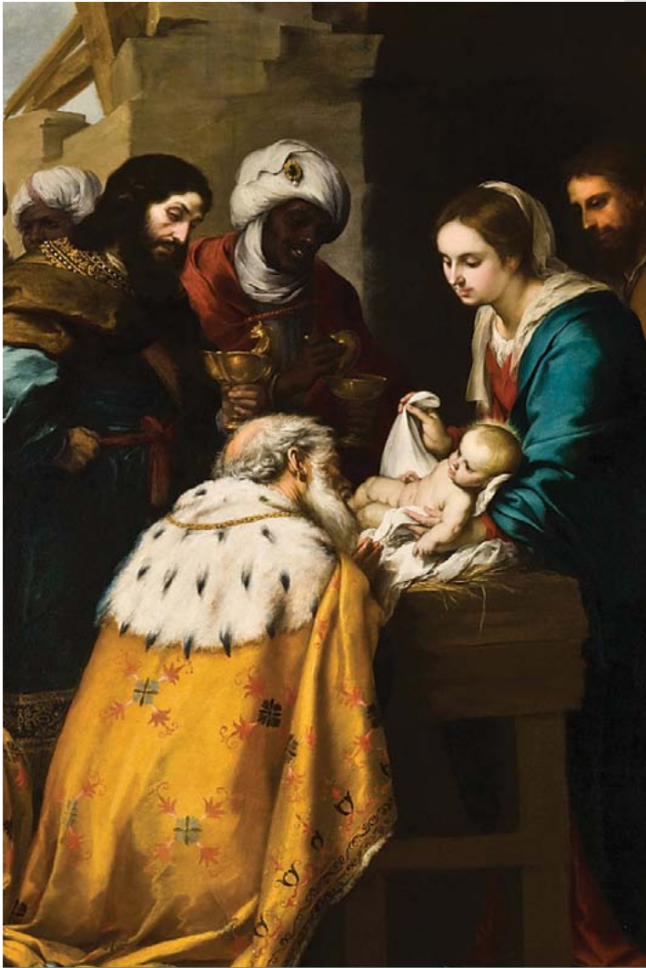
Adoração dos Magos, do pintor espanhol Bartolomé Esteban Murillo, no Toledo Museum of Art, Ohio- USA

A Igreja celebra hoje a Solenidade da Epifania (palavra de origem grega que significa “o que aparece”, “manifestação”) do Senhor, doze dias após comemorar o mistério do nascimento em Belém, onde o homem se revela como Deus aos pastores. Hoje Jesus apresenta-se como o Deus feito homem diante dos Reis Magos. Fecha-se o ciclo de Natal com o brilho de uma verdade universal: o Filho de Maria veio não só para o povo de Israel (pastores) mas para toda a humanidade (magos).