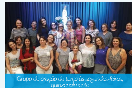
Grupo de oração do terço às segundas-feiras, quinzenalmente