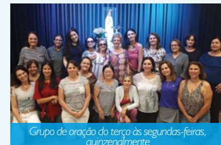
Grupo de oração do terço às segundas-feiras, quinzenalmente