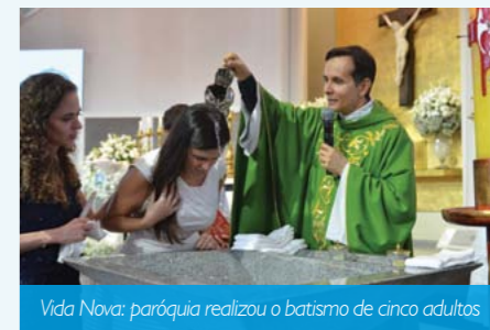
Vida Nova: paróquia realizou o batismo de cinco adultos