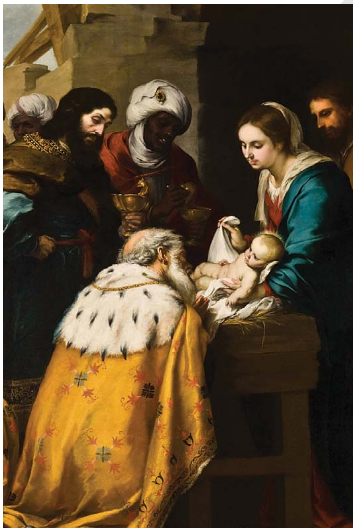
Adoração dos Magos, do pintor espanhol Bartolomé Esteban Murillo, no Toledo Museum of Art, Ohio- USA