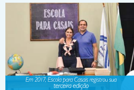
Em 2017, Escola para Casais registrou sua terceira edição