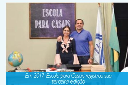
Em 2017, Escola para Casais registrou sua terceira edição