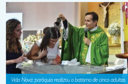
Vida Nova: paróquia realizou o batismo de cinco adultos