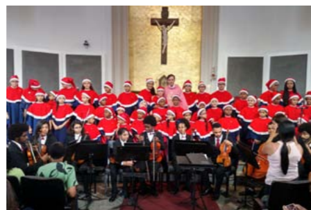
Apresentação reuniu crianças e adolescentes que formam um coral de 45 vozes

do Tribunal de Justiça e da Paróquia Nossa Senhora Rainha e disse que "além da parte musical, as crianças e adolescentes também desenvolvem outras habilidades, como foco, disciplina, concentração". A maestrina contou que todas estavam muito alegres por realizar a apresentação na semana do Natal na NSRainha.