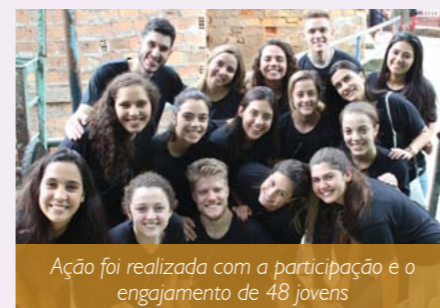
Ação foi realizada com a participação e o engajamento de 48 jovens