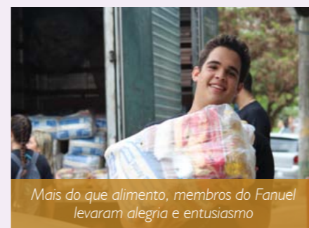
Mais do que alimento, membros do Fanuel levaram alegria e entusiasmo