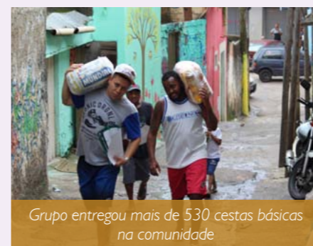
Grupo entregou mais de 530 cestas básicas na comunidade

Renata avalia que 2017 foi um ano de muitas ações para o Acorda, que realizou uma média de cinco a seis visitas por mês. O grupo fechou o ano com um jantar completo para os moradores em situação de rua, na última quarta-feira, dia 20, quando os jovens levaram, além do alimento e das bebidas (sucos e refrigerantes), mesas, cadeiras, toalhas, talheres e copos. A participação no projeto é aberta a qualquer pessoa que queira ajudar. Basta acessar o Instagram (@acordafanuel) e preencher o formulário que o grupo entra em contato.