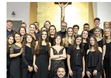
Evento contou com a participação de todos os ministérios de música da Paróquia

A médica lembrou que devemos sempre lembrar que Jesus é a grande razão da alegria do Natal, porque hoje nasceu o Salvador.