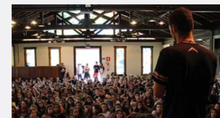
Milagres: reflexões sobre os feitos de Jesus