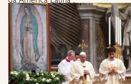
Papa Francisco sobre Guadalupe: “Nunca seremos órfãos”

Em 1910 o Papa S. Pio X proclamou Nossa Senhora de Guadalupe “Padroeira da América Latina”, e em 1945, o Papa Pio XII a proclamou “Imperatriz da América Latina”.