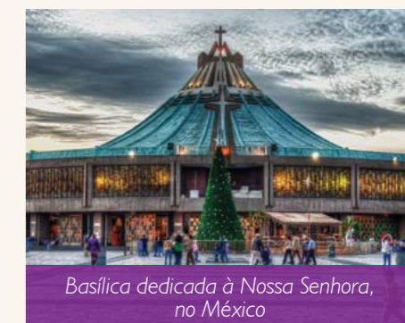
Basílica dedicada à Nossa Senhora, no México