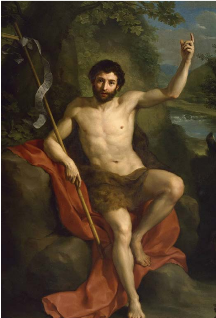
João Batista pregando no deserto (Anton Raphael Mengs - 1758 -1771)