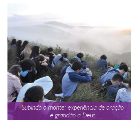
Subindo o monte: experiência de oração e gratidão a Deus

o quanto somos chamados a santidade e quais devem ser as nossas atitudes para alcançá-la. Todas as pregações e momentos de oração me fizeram perceber como Deus se faz nas coisas simples e pequenas para atingir nossos corações de maneira grandiosa”. Os encontros do GOFF são realizados às quintas-feiras, às 19h30, no salão Paroquial Pedro. O último de 2017 será nesta quinta-feira, dia 07/12.