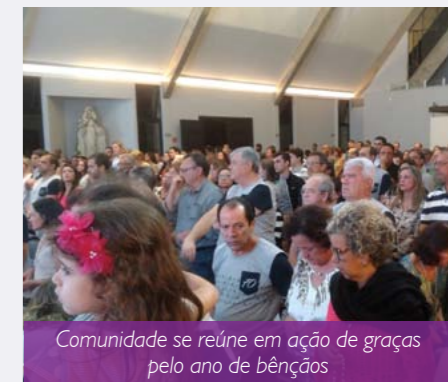
Comunidade se reúne em ação de graças pelo ano de bênçãos