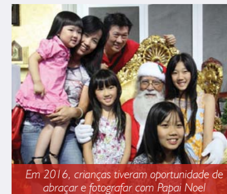
Em 2016, crianças tiveram oportunidade de abraçar e fotografar com Papai Noel