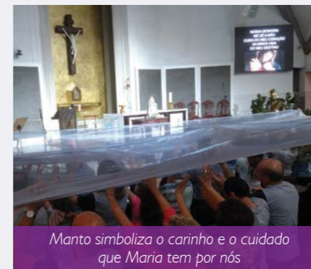
Manto simboliza o carinho e o cuidado que Maria tem por nós

Como acontece sempre nesses encontros de oração, haverá um momento muito especial de devoção à Maria, quando um manto, simbolizando todo o carinho e cuidado que a nossa Mãe tem por nós, é passado sobre a cabeça dos participantes. Ao final da Oração do Terço, os organizadores vão distribuir folhetos com orações especiais para todas as pessoas. Venha participar, trazendo a família e seus convidados!