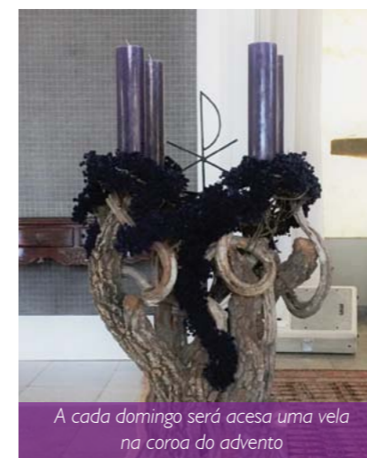
A cada domingo será acesa uma vela na coroa do advento