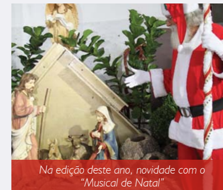
Na edição deste ano, novidade com o “Musical de Natal”