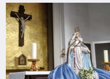
Momento especial de oração, louvor e reflexão aos pés de NSRainha