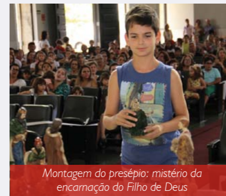
Montagem do presépio: mistério da encarnação do Filho de Deus