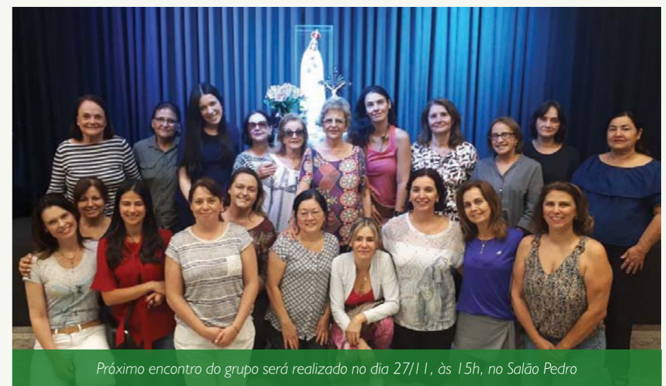
Próximo encontro do grupo será realizado no dia 27/11, às 15h, no Salão Pedro

O próximo encontro será realizado no dia 27 de novembro, às 15h. A entrada é aberta a todos os interessados. Mais informações na secretaria paroquial: (31) 3286-3034.