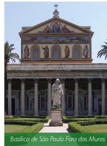
Basilica de São Paulo Fora dos Muros

No dia 18 de novembro a Igreja celebra a dedicação das Basílicas dos Apóstolos São Pedro e São Paulo, templos em Roma que contêm os restos destes dois grandes apóstolos do cristianismo e símbolos da fraternidade e da unidade da Igreja. A Basílica de São Pedro no Vaticano foi construída sobre o túmulo do Apóstolo, que morreu crucificado de cabeça para baixo. No ano 323 o imperador Constantino mandou construir aí a Basílica dedicada àquele que foi o primeiro Papa da Igreja. A atual Basílica de São Pedro demorou 170 anos para ser construída. Começou com o Papa Nicolás V em 1454 e foi terminada pelo Papa Urbano VIII, que a consagrou no dia 18 de novembro de 626.