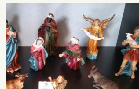
Tempo de Natal: Presépios remontam o nascimento de Cristo e convidam à oração