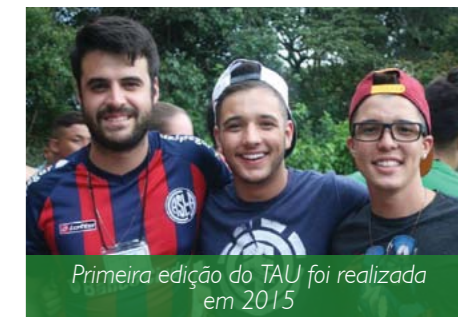
Primeira edição do TAU foi realizada em 2015