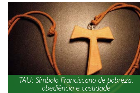
TAU: Símbolo Franciscano de pobreza, obediência e castidade