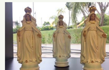
Uma das peças mais procuradas na loja, imagem da padroeira traz cores e novo design