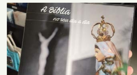
Agenda NSRainha 2018 traz liturgia diária e espaço para registro de atividades pessoais

Parte da renda da loja é destinada às obras sociais da Paróquia Nossa Senhora Rainha, tanto para a igreja do Belvedere como para a Comunidade Bom Jesus do Vale (Rua Dimas Henrique de Freitas, 17, no Vale do Sereno, em Nova Lima), onde a loja tem uma filial que funciona aos domingos, de 10h às 11h30.