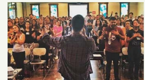
Encontro reuniu cerca de 170 participantes na casa de retiro Acampamento MPC

contro” são realizadas pregações, orações e louvor. Informações: (31) 3286-3034.