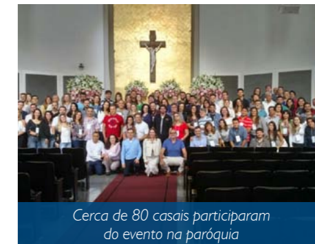
Cerca de 80 casais participaram do evento na paróquia

efetiva-sexual”. Ela lembrou que, para uma noite de comunhão efetiva sexual, o casal deve começar a preparação desde a manhã a nutrir essa comunhão e que “os casais que se conhecem melhor um ao outro, têm mais chances de terem uma vida sexual mais efetiva”. A terceira palestra foi sobre o perdão (“Perdoar ou não perdoar, eis a questão”). Ela ressaltou que todo casal deve convidar o perdão para chegar primeiro, lembrando que Jesus nos ensinou a perdoar quantas vezes forem necessárias.