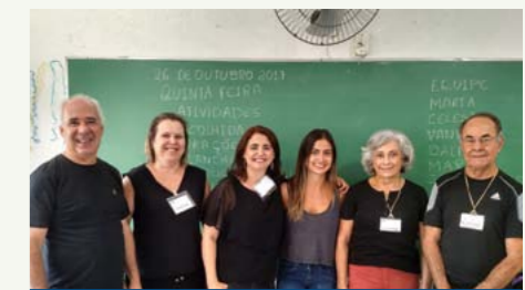
Equipe do Projeto de Acompanhamento Escolar