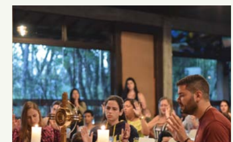
Jovens viveram momentos de adoração e intimidade com Deus