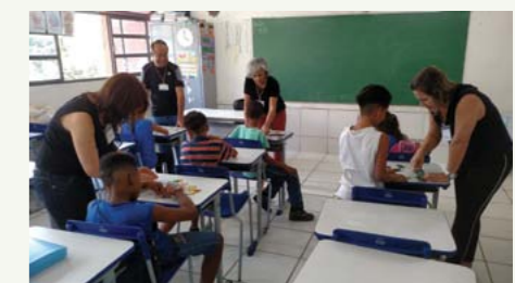
Os voluntários da Pastoral Social NSRainha dedicam suas tardes em escola do Aglomerado Santa Lúcia