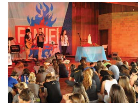
Encontro reuniu cerca de 160 participantes

rosas em homenagem à Maria, num momento que, com certeza, tocou o coração de todos”. A Celebração da Crisma será no dia 8 de dezembro e os encontros são realizados todos os domingos, às 16h, no Salão Pedro da NSRainha.