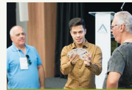
Apresentação de ilusionismo cativou o público