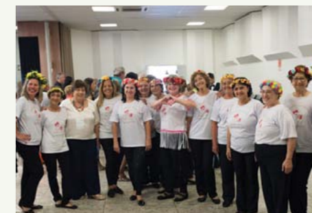
Grupo de dança sênior “Maturidade sem Fronteiras”