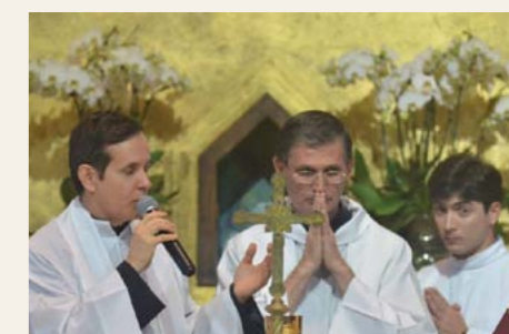
Pela Eucaristia, Cristo transforma sua vida de homem em vida de Filho de Deus