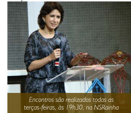
Encontros são realizados todas as terças-feiras, às 19h30, na NSRainha