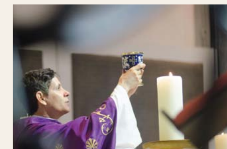
A Missa é o centro da fé, é o cerne do Cristianismo

Pela Eucaristia, Jesus está presente em Corpo, Alma, Divindade, na Hóstia consagrada, para ser nosso remédio e sustento.