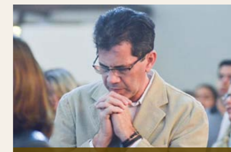
A Missa preserva-te de muitos perigos e adversidades que te abateriam