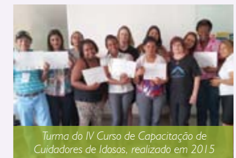
Turma do IV Curso de Capacitação de Cuidadores de Idosos, realizado em 2015

gunda parte da avaliação é feita por meio da elaboração de um Estudo Dirigido de cada disciplina, num total de 16 temáticas.