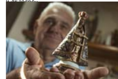
Aparecida: devoção popular começou em 1717

Santíssima apresentar-se no Brasil por meio da imagem que hoje veneramos. Ela quis despertar no peito do próprio camponês essa sede mais intensa, essa consciência de que, sem a presença de Cristo em nossas vidas, nada podemos fazer, senão pecar e destruir. Nossa Senhora da Conceição Aparecida é um farol luminoso sobre a altíssima vocação do povo brasileiro: a vocação à santidade.