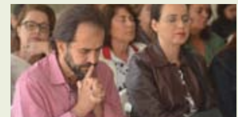
Encontro levou participantes à uma experiência de oração e reflexão