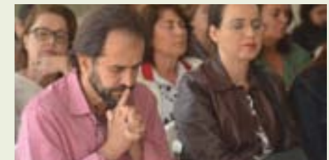
Encontro levou participantes à uma experiência de oração e reflexão