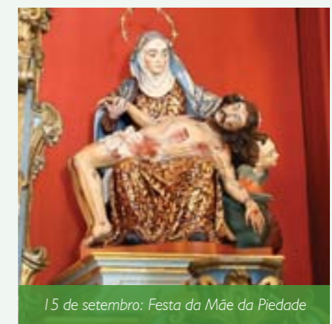
15 de setembro: Festa da Mãe da Piedade

também um convite para que cada um viva misericordiosamente, pois nas nossas vidas não pode faltar o tempero fundamental da misericórdia” declarou dom Walmor Oliveira de Azevedo, Arcebispo Metropolitano de Belo Horizonte.