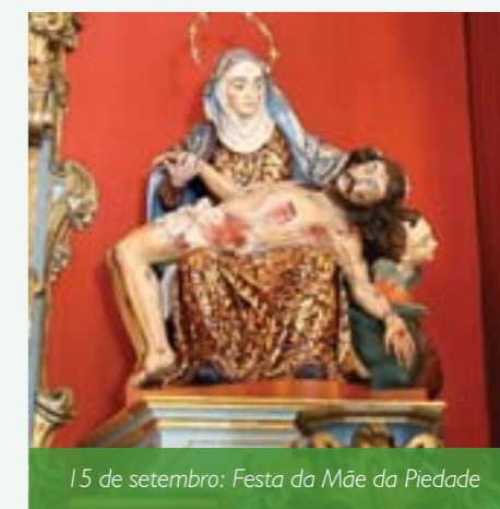
15 de setembro: Festa da Mãe da Piedade

também um convite para que cada um viva misericordiosamente, pois nas nossas vidas não pode faltar o tempero fundamental da misericórdia” declarou dom Walmor Oliveira de Azevedo, Arcebispo Metropolitano de Belo Horizonte.