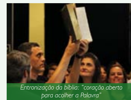
Entronização da bíblia: "coração aberto para acolher a Palavra"