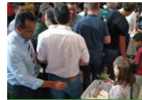
Todos os pais receberam um envelope com uma cartinha, “assinada” por “Teu Pai, Deus”