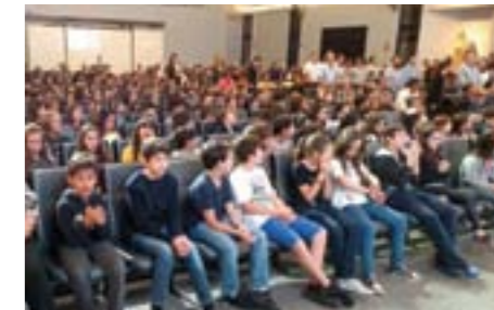
A homenagem aos pais reuniu quase 300 crianças da Catequese da Paróquia Nossa Senhora Rainha