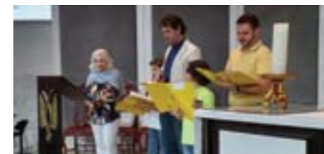
Os pais e seus filhos catequizando fizeram a leitura da meditação sobre a oração do Pai Nosso