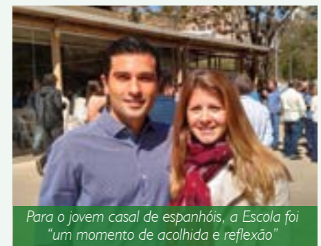
Para o jovem casal de espanhóis, a Escola foi “um momento de acolhida e reflexão”