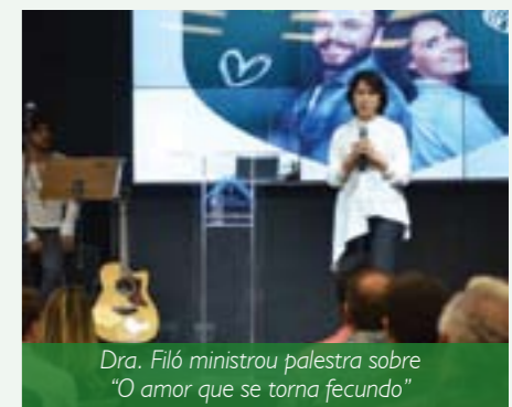
Dra. Filó ministrou palestra sobre “O amor que se torna fecundo”