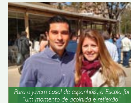
Para o jovem casal de espanhóis, a Escola foi “um momento de acolhida e reflexão”