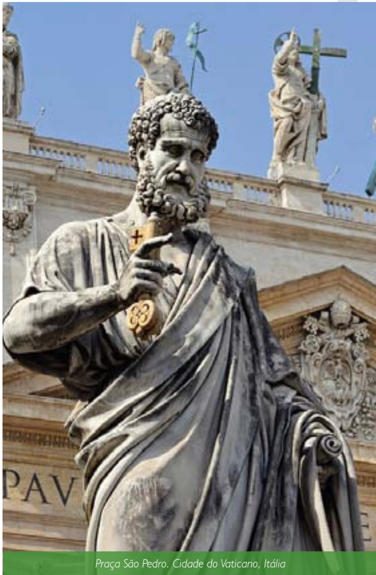
Praça São Pedro. Cidade do Vaticano, Itália