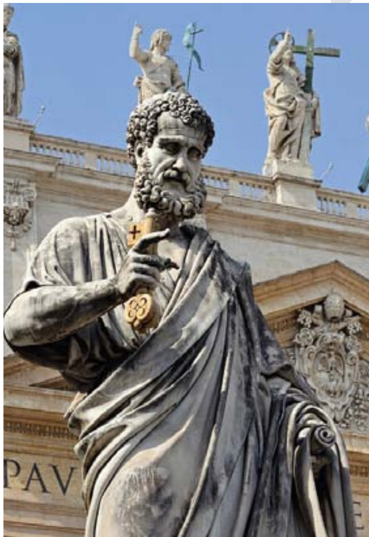
Praça São Pedro. Cidade do Vaticano, Itália