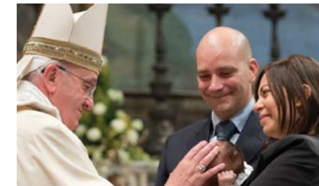
Papa: "Mães são o antídoto mais forte para a propagação do individualismo egoísta"