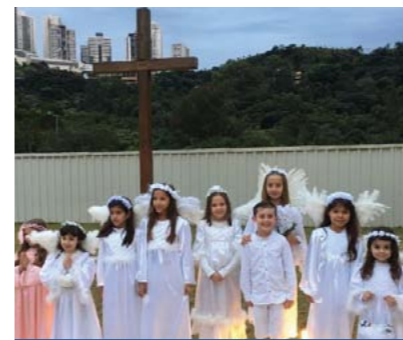
Crianças da comunidade realizaram a coroação da imagem de Maria.