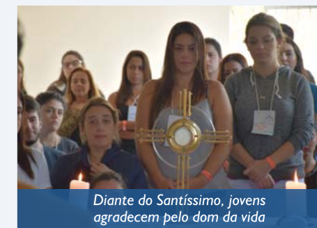
Diante do Santíssimo, jovens agradecem pelo dom da vida